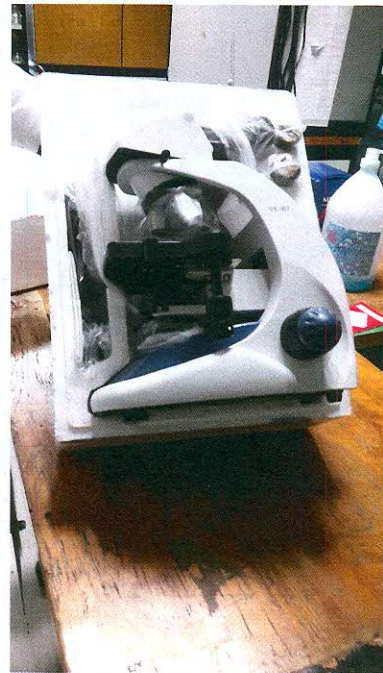
MICROSCOPIO BINOCULAR BIOLÓGICO