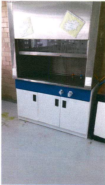
CAMPANA DE EXTRACCIÓN