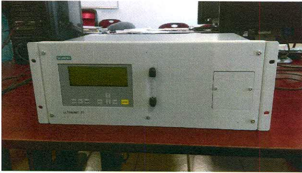
ANALIZADOR CONTINUO DE BIOGAS