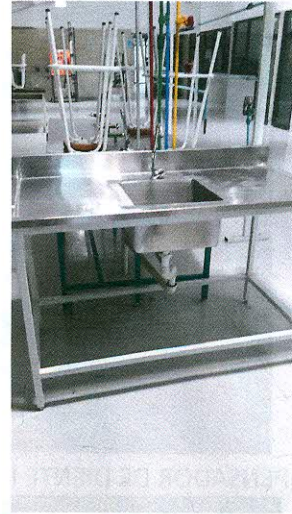
FREGADERO CON TARJA